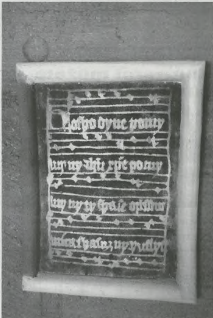
Obrazy jsou skutečně kompletně celé z hlíny.