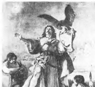
Titulní strana publikace Divadelní opony a sály v Žarošicích.